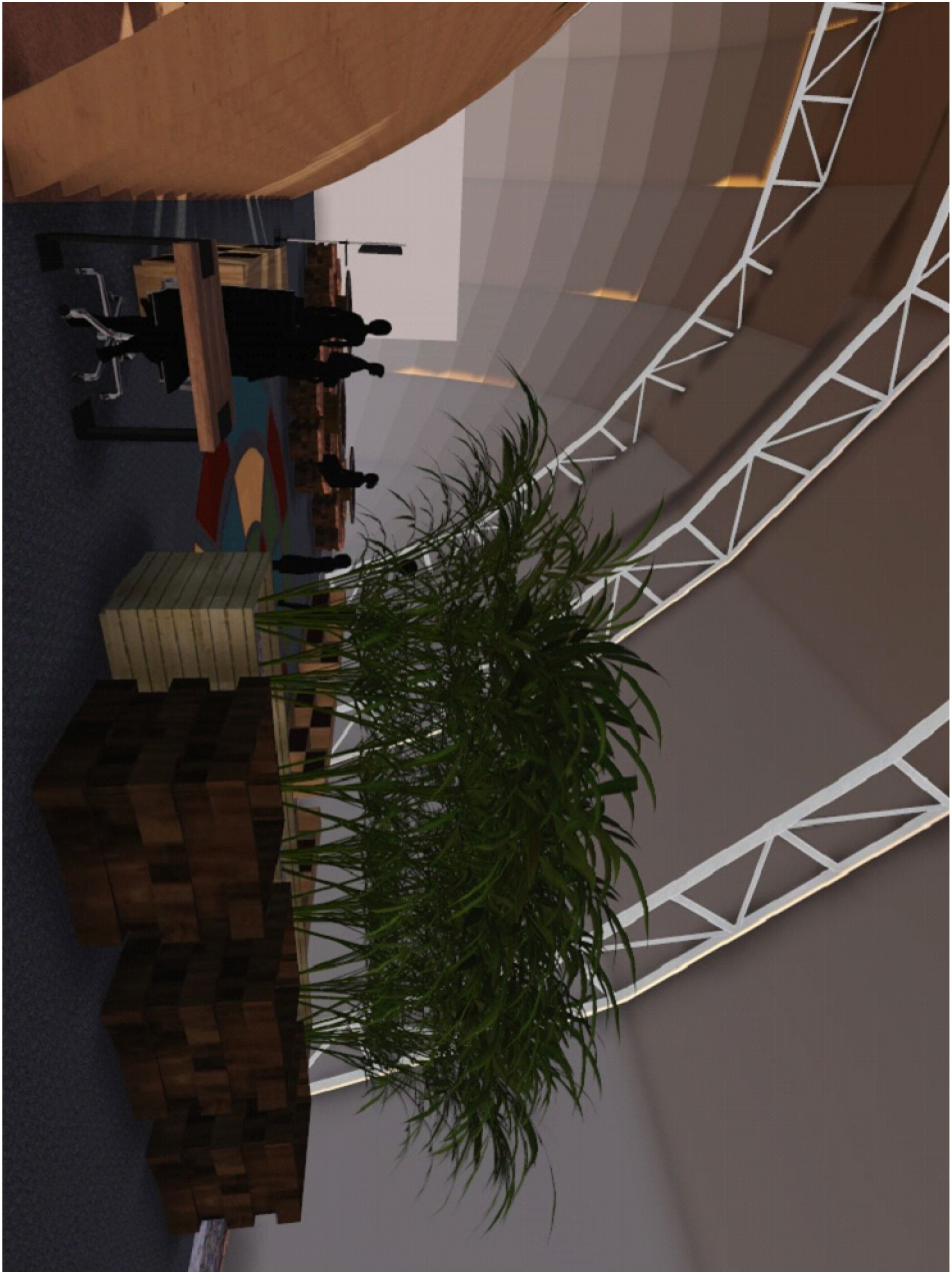
3 D_SETOR 7 - ESPAÇO KALI

OBSERVAÇÃO: Todas as medidas deverão ser confirmadas e conferidas in loco pelo executor